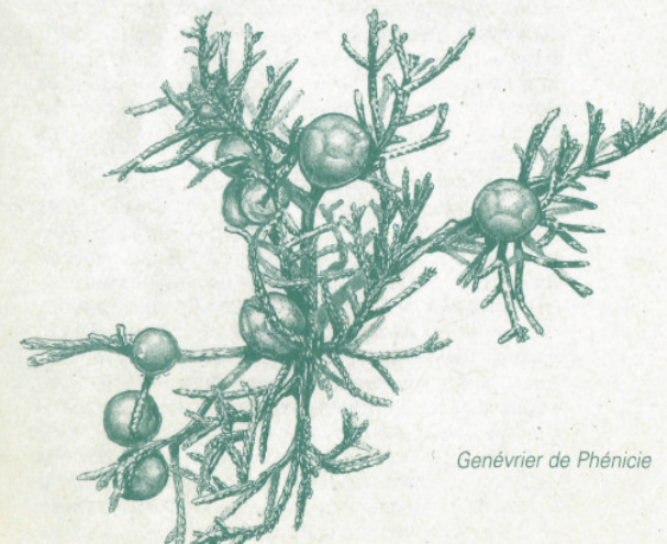
Genévrier de Phénicie

A la sortie de Capluc, on se rend compte de l'activité humaine dans ce site qui semble à première vue totalement stérile. Ce versant exposé au sud, protégé par les hautes falaises de dolomie* était entièrement cultivé grâce à des terrasses (céréales, fruitiers, vigne). Les conditions thermiques sont ici tellement favorables qu'on y retrouve la végétation méditerranéenne (par exemple le frêne méditerranéen, l'érable de Montpellier, etc.) la plus septentrionale de la région.