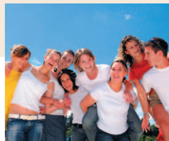
Les jeunes prêts pour la Chouette Enquête !