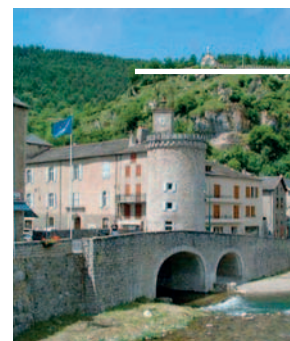
Meyrueis au cœur du Parc National des Cévennes

Chouette Enquête Ouvrez l'œil pendant vos week-ends ! Dénichez les indices dissimulés dans les monuments ou le paysage alentours pour résoudre l'énigme et poursuivre votre chemin ! voir p. 20