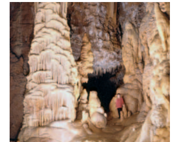
La grotte de Dargilan