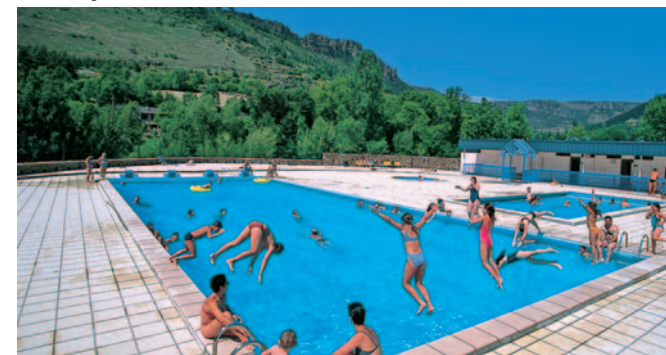
La piscine municipale gratuite